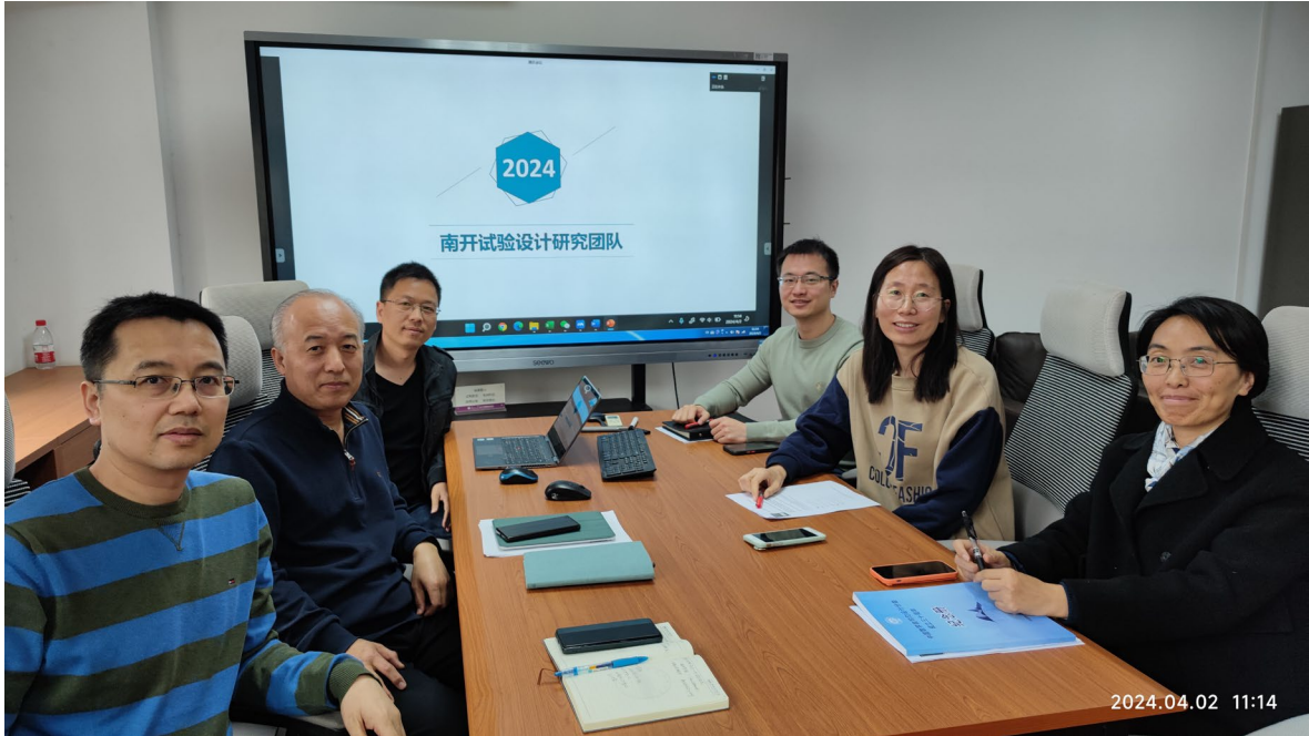
南开大学试验设计团队合影