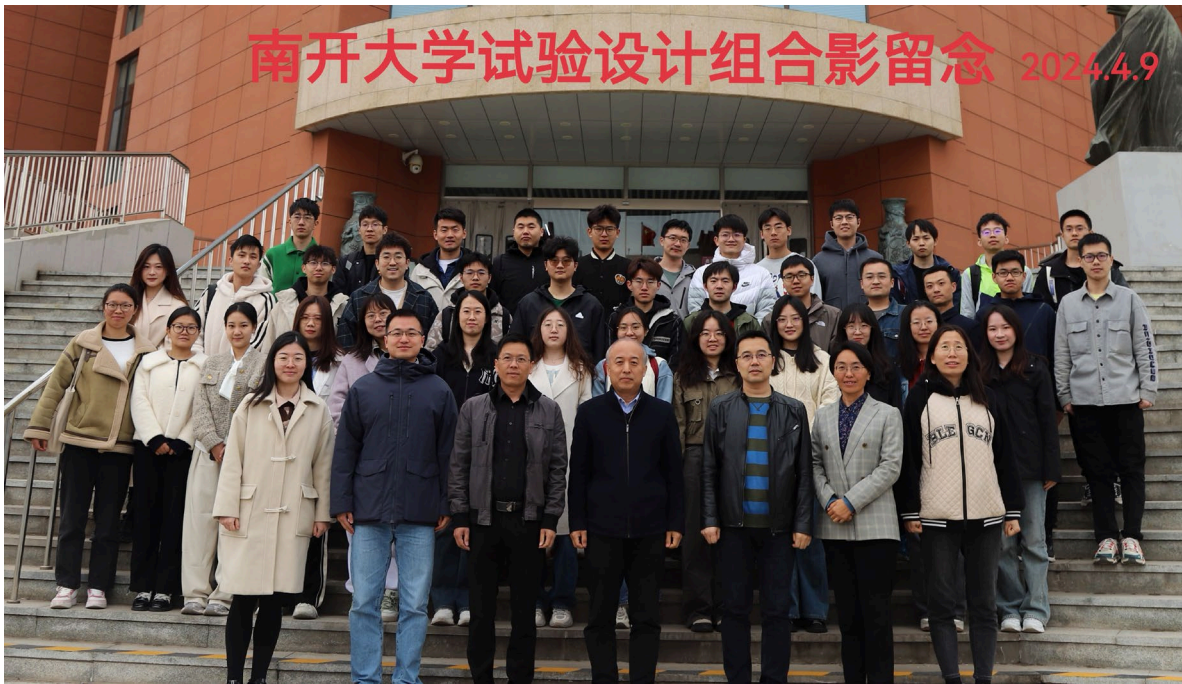
南开大学试验设计团队师生合影